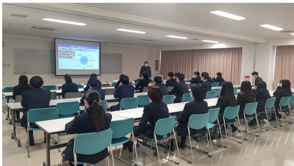
学科説明会の様子：『化学を必要とする産業分野は広いのです！！』

2022年12月20日(火)、阪南大学高等学校の高校生(100名程度)をお迎えし、大学体験会を開催しました。午前10時から開始し、工学部建築学科と機械工学科で施設・研究室体験をした後、知的財産学部、ものづくりセンター・モノラボアネックス、そして応用化学科で学科説明会および実験体験をしました。実験では、クロマトグラフィーの原理を利用して、パセリの色素を分離しました。